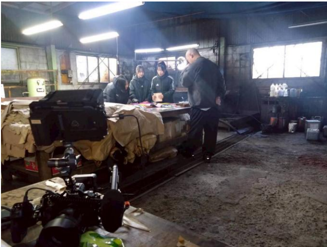
(革の説明を受け、使用革を選定する学生たち)

神戸ファッション専門学校等と連携し、学生によるレザーウェアのデザイン検討および制作に向けた打ち合わせを実施した。革素材を活用した衣装制作を通じて、革製品の魅力を表現する企画を立案した。