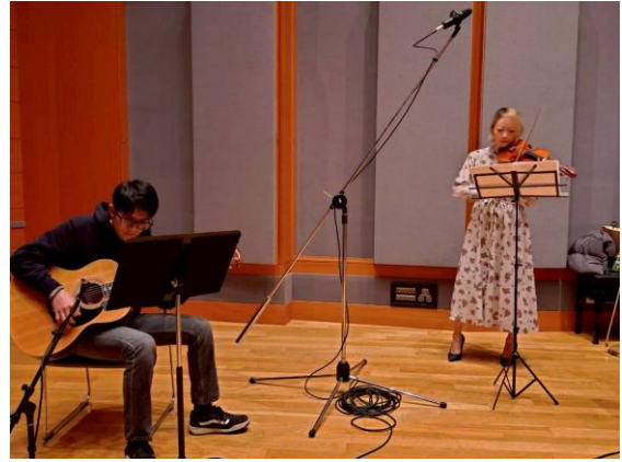
(レコーディングの様子)