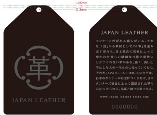
〈表面〉 仕様:ロゴ/UV厚盛り